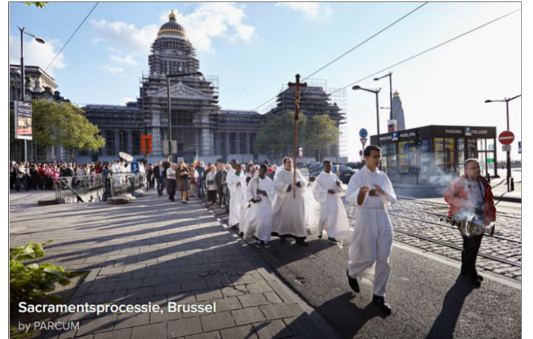
Sacramentsprocessie, Brussel

In Vlaanderen en België trekken jaarlijks tientallen processies door de straten. Verzameld rond een heiligenbeeld of reliëkschrijn trekt de gemeenschap in rijen door de straten. Banieren worden megedragen; als engelen of heiligen uitgedoste figuranten, ruiters, fanfares en bescheiden praalwagens begeleiden de optocht. Wie niet mee doet, plaatst een versierd altaartje bij de voordeur of strooit bloemen op straat. Het regent (vaak), een enkele keer schijnt de zon.