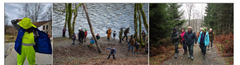
Klussen - MutskesWE - Lentewandeling

Laat je ondertussen in 2024 verleiden door de vele andere activiteiten en weekends die worden georganiseerd