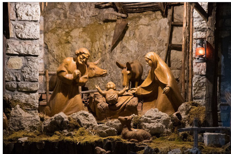
kerststal in Greccio

Beeld u eens in dat iemand langskomt en tegen u zegt: Zorg voor een plaats in het bos, graag ergens waar er stro ligt. Laat de mensen 's nachts naar het bos komen met fakkels. Daar zullen we kerst vieren. Beste mensen, dit gebeurde 800 jaar geleden.