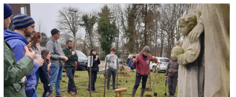
(c) © Erik Vanleeuw