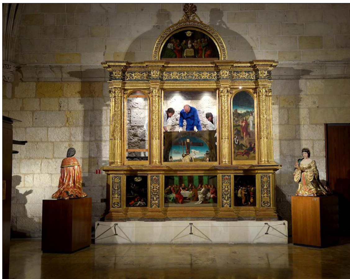
Begin juli werd het werk van Dirk Bouts de 'Triptiek van de kruisafneming' - ook wel de passietriptiek genaamd, in Granada ontmanteld en naar België overgebracht.