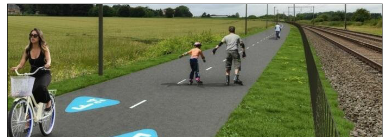
Fietssnelweg F24 Leuven

Een enorme meerwaarde voor onze gemeente