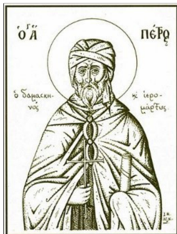
Sint Peter van Damascus

Gregorius van Nyssa zei dat vogels en andere dieren zich verheugen vanwege hun gebrek aan bewustzijn, terwijl de mens, die begiftigd is met intelligentie, nooit gelukkig is vanwege zijn verdriet; want zegt hij, we zijn niet waardig bevonden om zelfs maar kennis te hebben van de zegeningen die we hebben verloren. Daarom leert de natuur ons eerder te treuren, om-