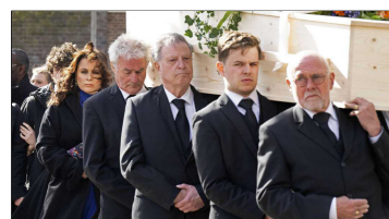
De kist met Huib Oosterhuis wordt na de afscheidsdienst in besloten kring de Westerkerk uitgedragen.

Huib Oosterhuis Allerheiligen 1933 - Eerste Paasdag 2023