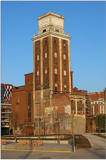
Oude toren in art deco

Met een bezoek aan het industrieel erfgoed van Leuven rond Okra SF op dinsdag 23 maart 2023 een reeks bezoeken af aan de pijlers van de Leuvense economie. Dit is een geslaagd initiatief van bestuurslid Mia en gedragen door onze polyvalente gids Anne. Wanneer zij dirigeert is succes gegarandeerd. Om niet te ontsnappen aan de security werden we verwelkomd en omgord met een licht rood beschermingsjasje.