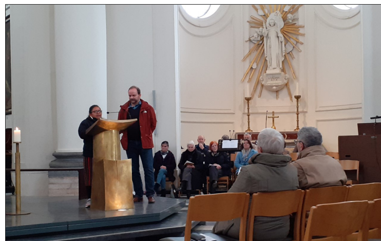
Haast verstopt achter de lezenaar tijdens haar getuigenis