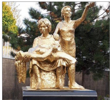
Getuig van de Hoop die in u leeft!