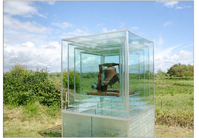
Hear Here Visit Leuven