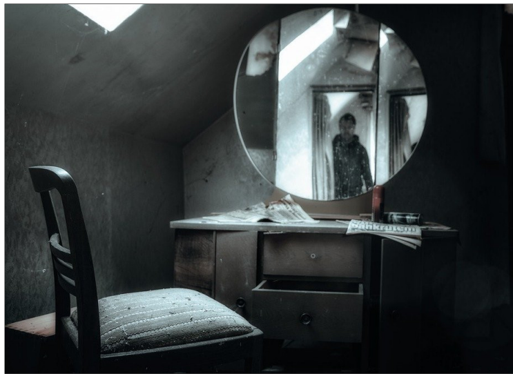
Spiegelte aan de wand

barmhartig is. Oordeel niet, dan zal er niet over je geoordeeld worden. Veroordeel niet, dan zul je niet veroordeeld worden. Vergeef, dan zal je vergeven worden. Geef, dan zal je gegeven worden; een goede, stevig aangedrukte, goed geschudde en overvolle maat zal je worden toebedeeld. Want de maat die je voor anderen gebruikt, zal ook voor jullie worden gebruikt.'