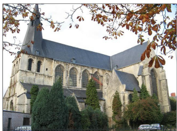
Sint-Jacobskerk Leuven

De stad Leuven wil van de Sint-Jacobskerk een overdekt plein maken, een ontmoetingsplek voor de buurt en het verenigingsleven.