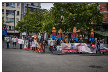
Animal Rights Protestactie aan Sint-Pieterskerk

Actievoerders houden stil protest tegen-dierenproeven