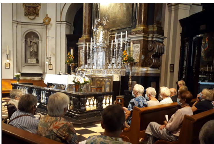
Mooie eigentijdse eucharistieviering in de basiliek

de leden van OKRA uitgenodigd. Zo trokken we met dertig leden en sympathisanten naar het gekende en geliefde bedevaartsoord. Bij aankomst kregen we eerst de gelegenheid om te genieten van een tas koffie en een stukje taart. Voor velen was dit de eerste keer dat ze van huis weg konden gaan na de lange maanden van beperkingen door de vele coronamaatregelen. Deze uitstap was een goede gelegenheid om het alleen thuis zijn en de eenzaamheid te doorbreken. Er werd dus gezellig geabbeld en veel nieuwsjes werden uitgewisseld.