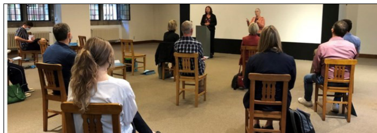
Stadsbibliotheek voor doven en slechthorenden

Bij de voorstelling van de vidiotour waren er uiteraard ook mensen van