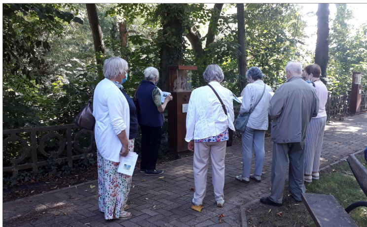
Met een aantal deelnemers deden we de kruisweg oefening

Elk jaar op de tweede woensdag van september organiseert Samana Sint Franciscus een bedevaart naar Scherpenheuvel. Dit jaar waren ook