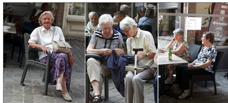
...en vooral om de plaatselijke horeca te bezoeken

ten wat oorlog is. Ieder zal onder zijn wijnrank zitten en onder zijn vijgenboom, door niets of niemand nog opgeschrikt” Een wens en een droom, ook voor onze tijd! Daarom werd gebeden dat deze droom ooit werkelijk zou worden en dat wij er ook zouden aan meewerken. Voor een zieke en voor het welslagen van een operatie, voor vrede in Afghanistan, voor verstandhouding in de gezinnen, voor het geluk van kinderen en kleinkinderen, voor de persoonlijke intenties van iedereen die aanwezig was. Na de mis was er nog ruim de tijd om een kaars te laten branden, en vooral om de plaatselijke horeca te bezoeken. Daar werd gezellig geproefd, verhalen werden uitgewisseld met vrienden en kennissen die we door de coronaepidemie zolang niet gezien hebben. Teverden en gelukkig keerden we terug naar huis. JefSnaet