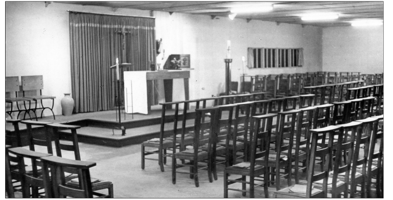
Kapel Don Bosco