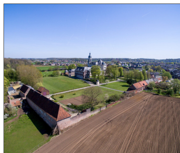
luchtfoto abdy

Kerkfabriek, Mind the Gap Leuven en stad Leuven vinden mekaar in de strijd tegen dakloosheid bij jongvolwassenen.