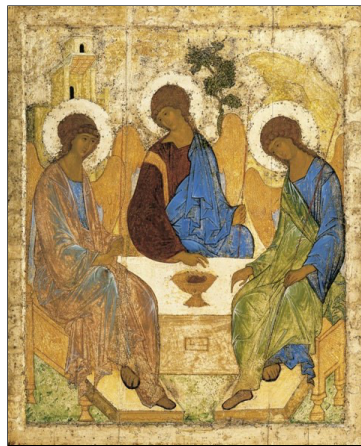
H. Drieëenheid icoon van Roelbljov 1412 Galerij Moskou

Don Bosco - Tussentijdse zondag 30 mei 2021