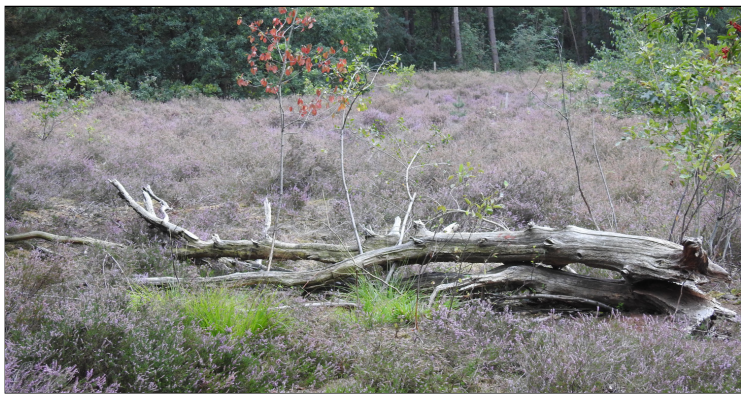
Ik vond ook vergankelijkheid op deze plek. Een grote boom was midden het gebied omgevallen.

Ik vond ook vergankelijkheid op deze plek. Een grote boom was midden het gebied omgevallen. Het moet al lang geleden zijn. Hij lag er door zon en regen helemaal verweerd bij. Een stille getuige van voorbij trots. Ik nam het beeld van deze plek in mijn geheugen op. Ik blikte deze impressie met mijn fototoestel in. Ik was blij dat ik naar de Kruisheide gelokt was.