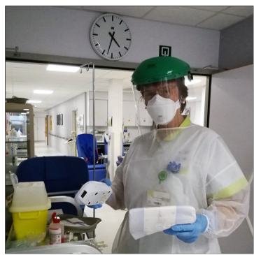
Uit de schaduw getreden

In 2020 zijn de onzichtbaren uit de schaduw getreden. Verzorgers. Sociaal werkers. Schoonmakers. Vuilnismannen. Postbodes. Leraren. Seizoenarbeiders. Huis-houdhulp. Vakkenvullers. Kas-siersters. Buschauffeurs. Ze hebben bergen verzet. Ze hebben al hun energie en heel hun kunnen aangesproken om het land recht te houden, om het virus te verslaan, om alles te doen draaien. Ze hebben getoond wat essentieel is. Dat doen ze al langer, maar nu werd het ook gezien. En gezegd. Eindelijk!