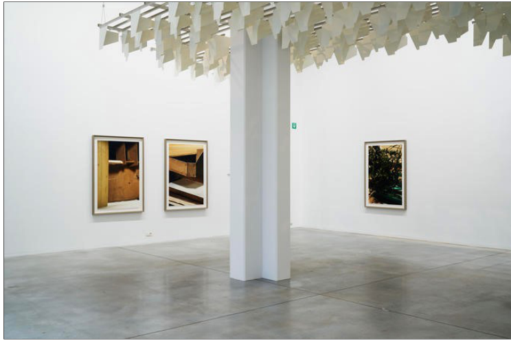
House of card

In afwachting dat we weer naar theaters en andere zalen mogen, kunnen we alvast cultuur opsnuiven in de al geopende musea.