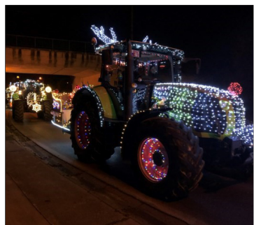
Tractor Run in Bierbeek

Zaterdagavond 26 december 2020 reden, voor de eerste keer, dertig tractoren, voorzien van lichtjes en de nodige kerstmuziek, een parcours van iets meer dan 22 kilometer doorheen de gemeente Bierbeek.