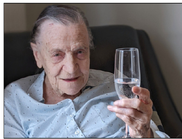
"Santeil" klinken we. Dit is óns moment van samenzijn...

Als kind vond ik het geweldig wanneer de deken, de pastoor of de onderpastoor thuis op bezoek kwamen. Het had iets feestelijks. De beste fles wijn en sigaren kwamen boven. Bovendien kreeg de graag geziene gast de beste zetel. Wij, de kinderen, schaarden ons allemaal blij rond hem. En dan maar vertellen... Onvergetelijke avonden waren dat!